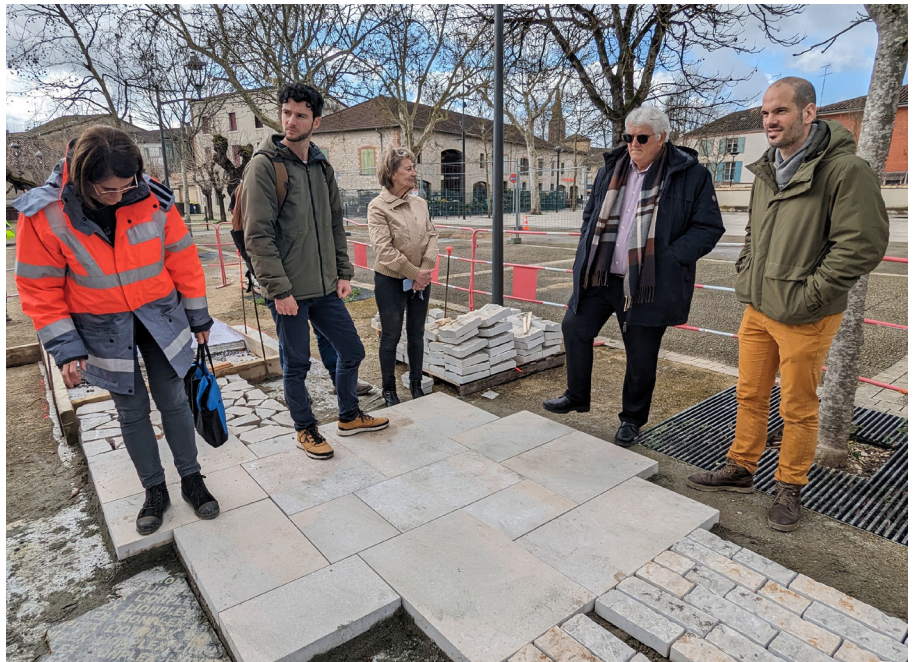
Ne pas jeter sur la voie publique

Côté trottoirs, toutes les bordures seront réalisées en pierre identique à celle du parvis pour un rendu plus harmonieux. La municipalité a entendu la demande lors des concertations d'avoir un revêtement simple à nettoyer et qui dure dans le temps. Un béton décoratif de qualité permettra un nettoyage facile tout en sécurisant la marche des piétons grâce à son aspect légèrement granuleux.